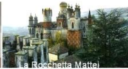
La Rocchetta Mattei