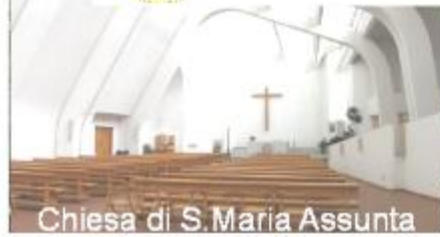
Chiesa di S. Maria Assunta

Domenica 08 Ottobre 2017 - ROCCHETTA MATTEI e GRIZZANA MORANDI ITINERARIO DI VISITA