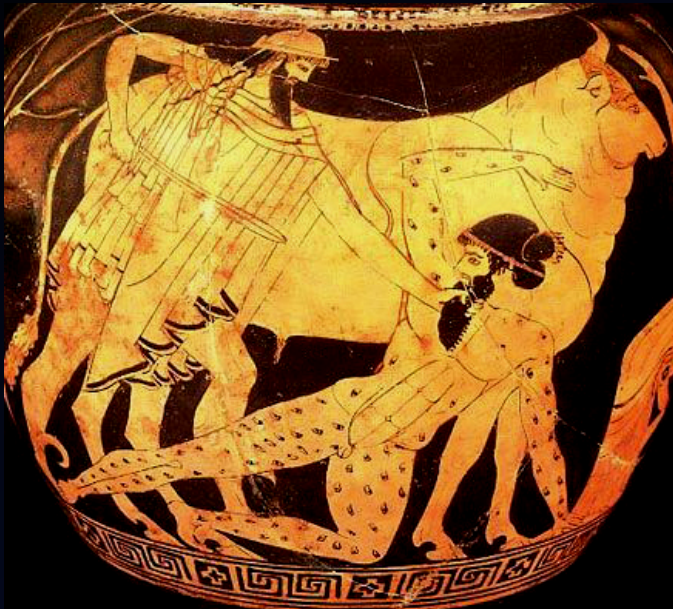
Decorazione di vaso attico raffigurante Hermes, Argo e Io, Kunsthistorischesmuseum/Vienna