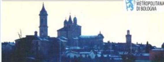
LO SKYLINE DELLA CITTÀ DI MEDICINA